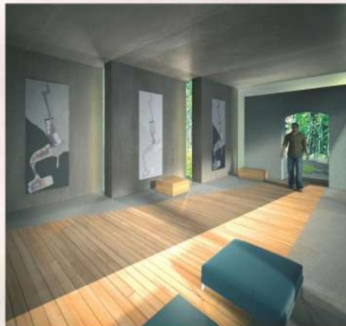
Camera de întâmpinare și prezentare