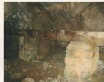
Peștera în care a fost depus tezaurul - interior