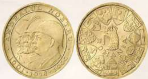
Moneda jubiliară „Ardealul Nostru”