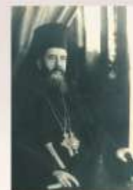
Mitropolitul Olteniei Nifon Criveanu

Comisia Monumentelor Istorice vă aduce viile sale mulțumiri pentru lăudabila dvs. inițiativă de a reface pe cheltuiala BNR chiliile distruse de incendiu la mănăstirea Tismana și este de acord ca lucrările de refacere să înceapă imediat.”