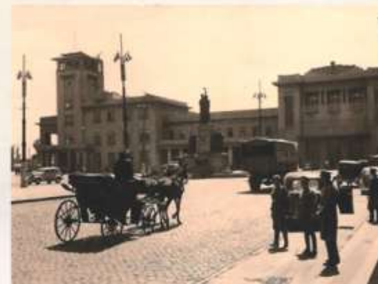
Gara de Nord, București