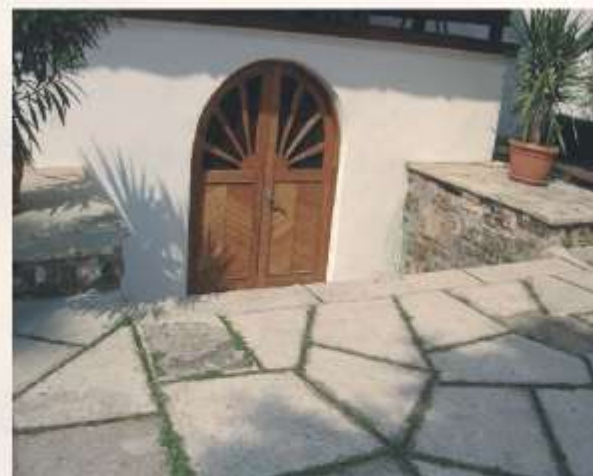
Intrarea în pivnița unde a fost depus tezaurul în iulie 1944