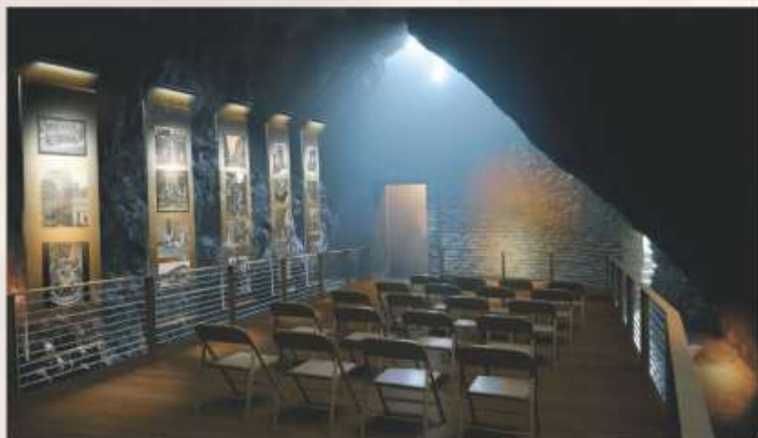
Sala nr. 1 din peșteră