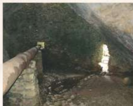
Peștera în care a fost depus tezaurul - interior