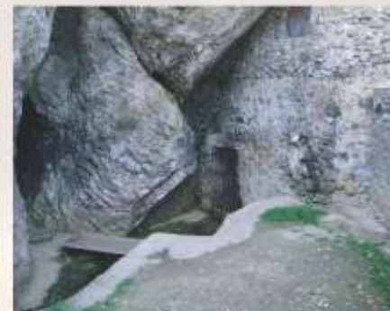
Intrarea în peștera în care a fost depus tezaurul

Din 1928 a fost director, apoi viceguvernator și, în perioada 30.09.1944-14.03.1945, guvernator al BNR.