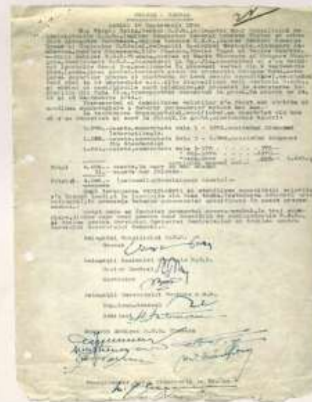
Procesul-verbal din 16 septembrie 1944, privind mutarea tezaurului BNR în grotă din vecinătatea mănăstirii Tismana