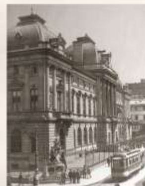
Palatul Băncii Naționale a României din București