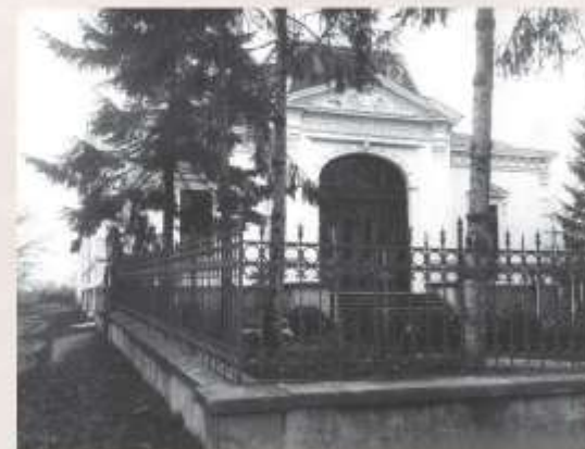
Sediul Agenției BNR, Târgu Jiu